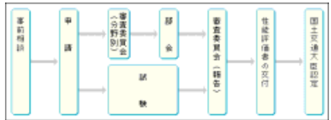
図1 性能評価の標準的な手続きの流れ 7)

図1には日本建築センターにおける建築基準法に基づく性能評価業務の標準的な手続きの流れ 7) を示す。事前相談から申請書類の提出、審査委員会での説明、部会での審議、審査委員会での報告を経て、性能評価書が交付される。その後、国土交通大臣に提出し、大臣の認定を受ける。建築基準法第20条第一号の規定に基づく国土交通大臣の認定に関する性能評価に要する期間は、一般に1ヵ月程度であり、性能評価後の大臣認定取得に要する期間は概ね2週間程度である。ただし、性能評価の期間は、個別の事案の事前準備状況によって異なる。また、風車に使用する材料の化学成分、機械的性質を示す試験データが不足している場合には追加試験を行う必要があるため、追加試験に要する分だけより時間がかかる場合がある。性能評価機関の連絡先及び業務内容は財団法人建築行政情報センター 8) のホームページに掲載されている。